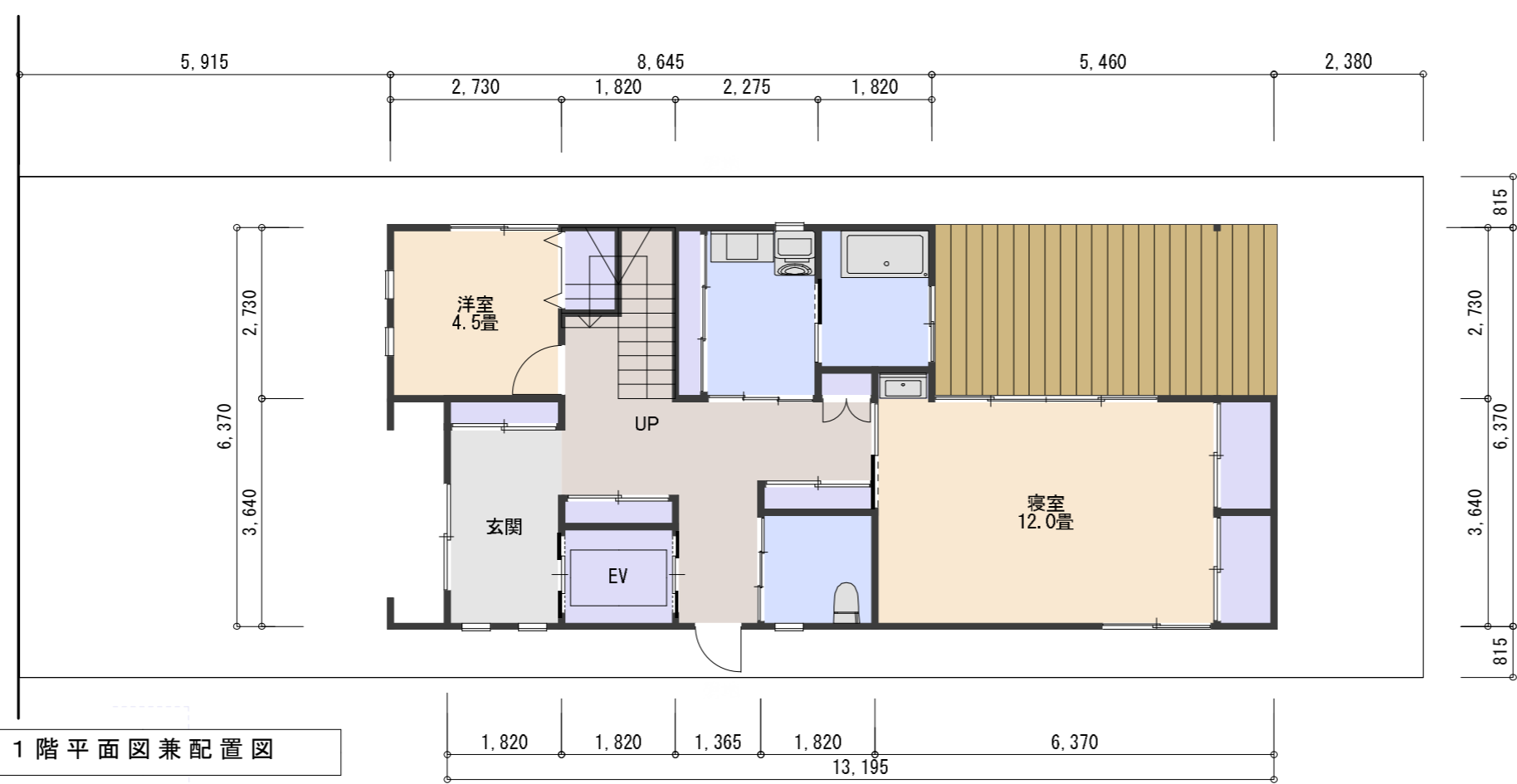
1階平面図兼配置図